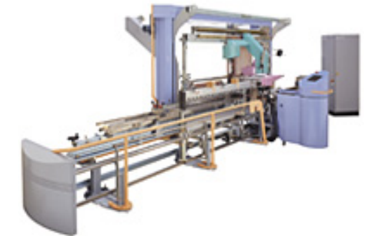
Abb: Einziehmaschine für Webereien

Absicht war es, auf Basis der Ergebnisse des Wertschöpfungs-Assessments die Zielstruktur und ein geeignetes Vorgehen für ein anschliessendes Optimierungsprogramm zu definieren. Die Erkenntnisse aus Eigen- und Fremdsicht sollten dabei umfassende Anhaltspunkte über konkrete Massnahmen und deren Bearbeitungsprioritäten liefern. Ein wichtiger Aspekt war zudem das gegenseitige Kennenlernen und damit die Versachlichung weiterer Diskussionen und eine fokussierte Themenbearbeitung sicherzustellen.